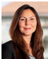
Katja Streiff Députée au Grand Conseil PEV