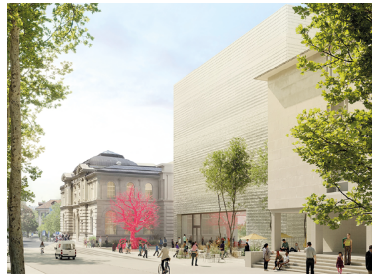
Rendering : Vue depuis la Waisenhausplatz

Il y a 150 ans, Albert Anker œuvrait pour la naissance du Musée des Beaux-Arts de Berne. Ce projet de rénovation honore cet héritage, lui insuffle une nouvelle vie et le transmet aux générations futures.