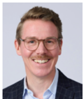
Claude Grosjean Député au Grand Conseil PVL